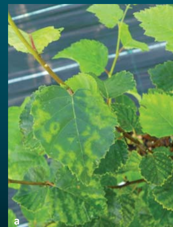
Abb. 7 CLRV-verdächtige Symptome an Unterlagen der finnischen Pfropfreiser a) Adernbänderung, Ringflecken, Chlorosen b) Chlorotische Flecken, Adernbänderung, Blattrollen, Mosaik