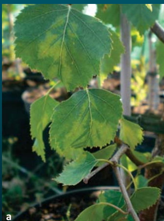
Abb. 5 CLRV-verdächtige Symptome an deutschen gepfropften Birken a) Adernbänderung, Blattrollen b) Chlorotische Flecken, Adernbänderung