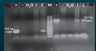
Abb. 8 CLRV-Nachweis in Blattmaterial (Unterlage) finnischer Birken durch Amplifikation eines 162 bp (CP) und eines 567 bp (RdRP) langen Fragments mittels RT-PCR, (+) CLRV-infizierte deutsche Birke, (-) nicht CLRV-infizierte C. quinoa , (H 2 O) Wasserkontrolle, (1-2) Unterlagen finnischer Birken, (M) 50 bp