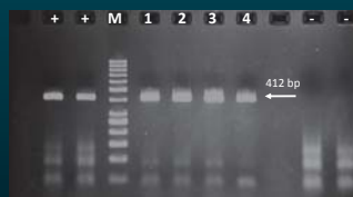
Abb. 6 CLRV-Nachweis in Blattmaterial deutscher Birken durch Amplifikation eines 412 bp langen Fragments in der IC-RT-PCR, (+) Positivkontrolle CLRV-infizierte deutsche Birke, (-) Negativkontrolle nicht CLRV-infizierte C. quinoa , (1-4) deutsche Birkensämlinge, (M) 50 bp