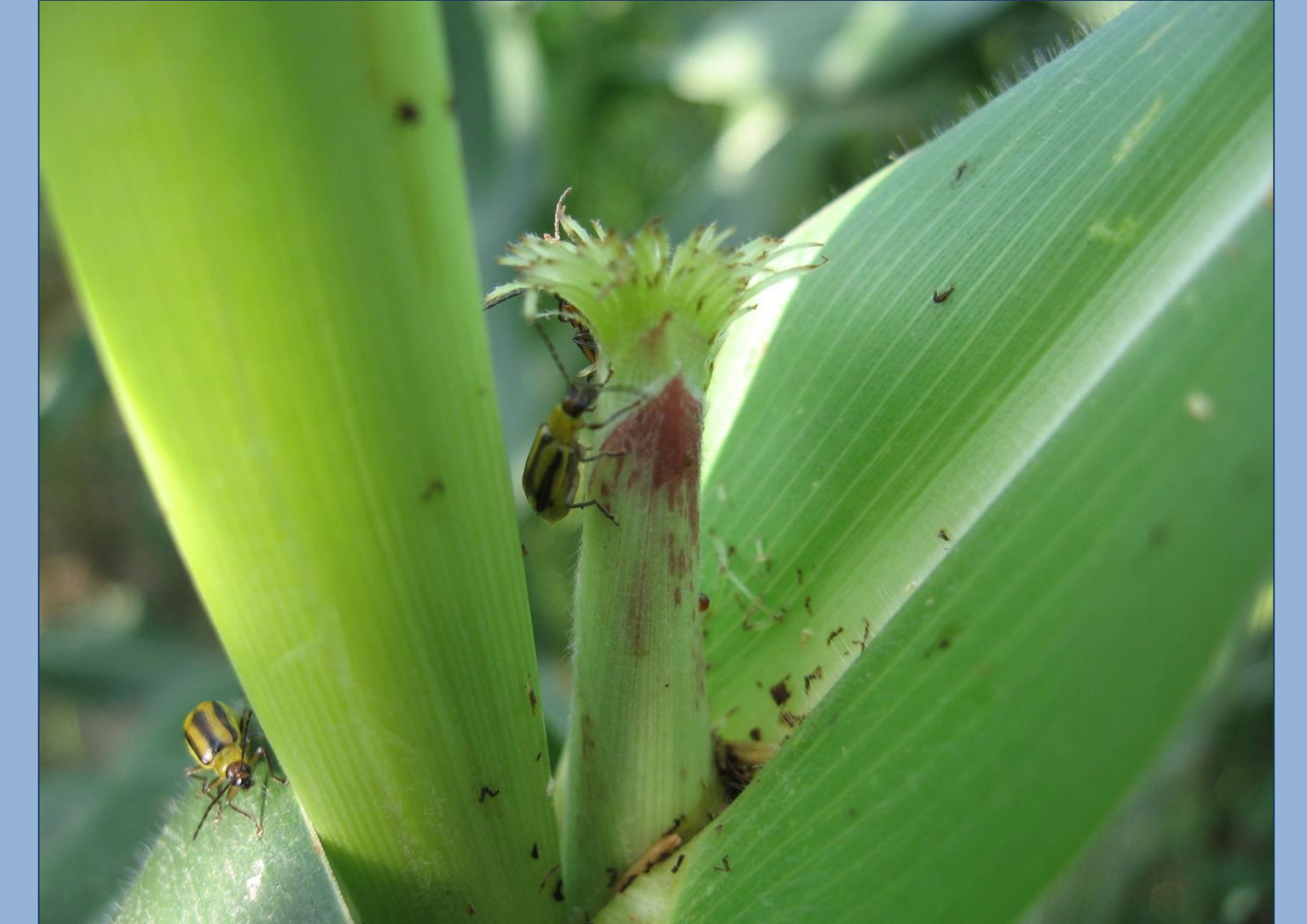
Abb. 3: Adulte D. v. virgifera beim Fraß an den Narbenfäden