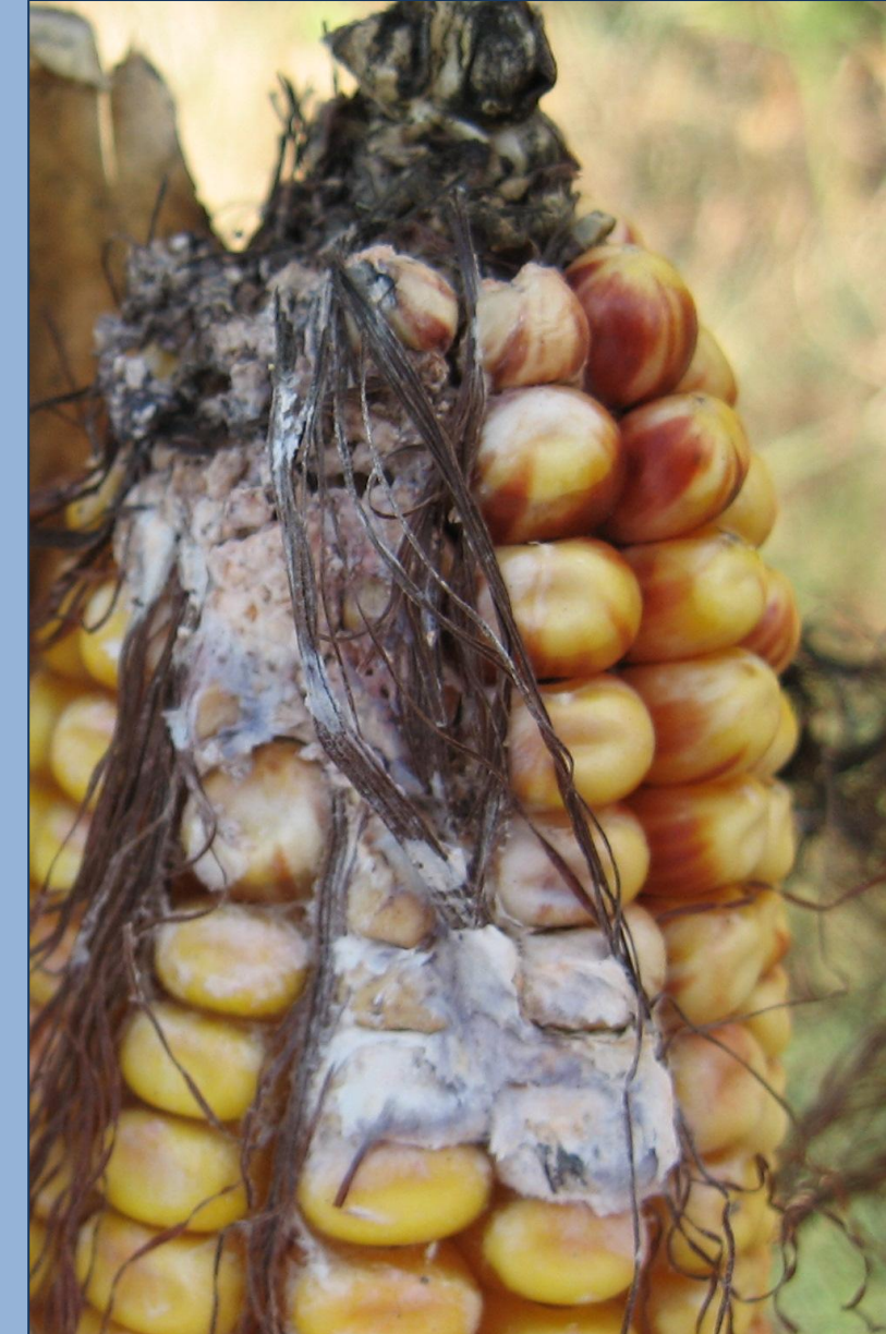
Abb. 1: Durch Fusarium spp. verursachte Fäulesymptome an Maiskolben

Von Fusarium spp. verursachte Wurzel-, Stängel- und Kolbenfäulen (Abb. 1) sind im Maisanbau meist mit erhöhten Mykotoxinkonzentrationen des Ernteguts verbunden. Neben der Schaffung von Eintrittspforten durch Fraßaktivitäten, insbesondere an Narbenfäden und Körnern, fungieren Maiszünslerlarven (Abb. 1) und adulte Maiswurzelbohrer (Abb. 2) auch als Vektoren speziell mikrokondialer Pilzarten (Munkvold 2003).