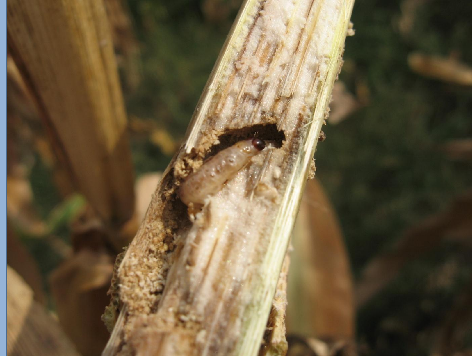
Abb. 2: Larve von O. nubilalis in aufgeschnittenem Stängel